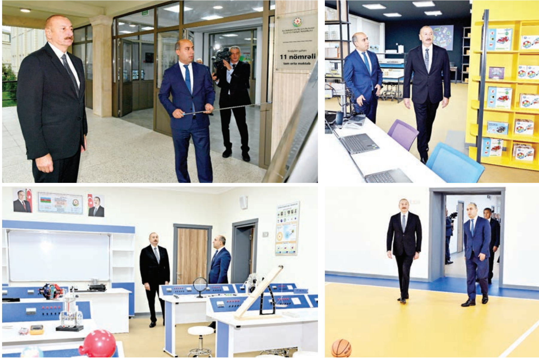
Əvvəli 1-ci sahə.

Prezident İlham Əliyev Xırdalan şəhər 11 nömrəli tam orta məktəbin yeni binasının açılışında iştirak edib