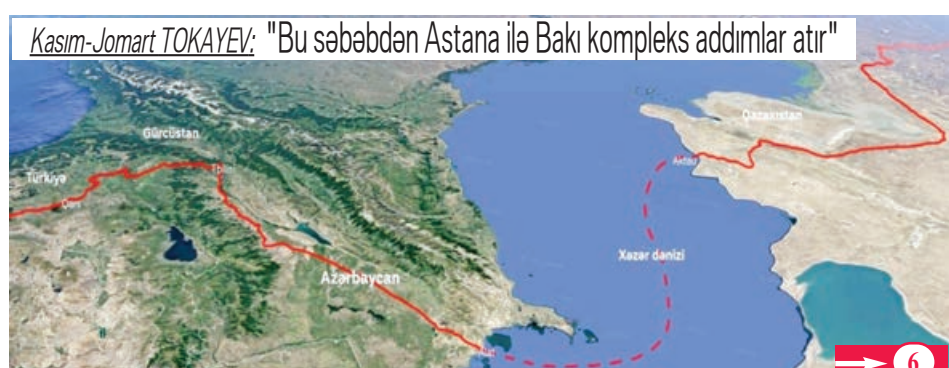
Kasım-Jomart TOKAYEV: "Bu səbəbdən Astana ilə Bakı kompleks addımlar atır"