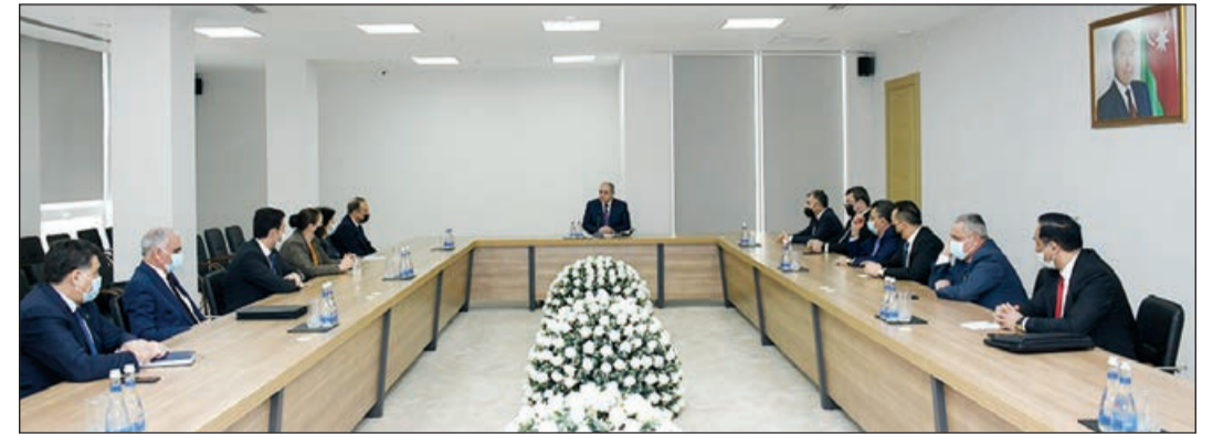
Martin 12-də Yeni Azərbaycan Partiyasının Təftiş Komissiyasının iclası keçirilib.