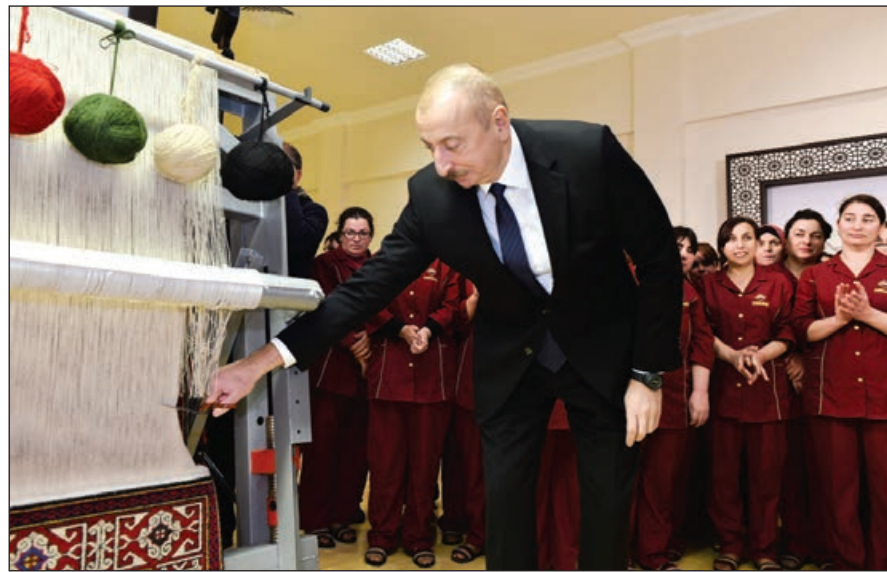
Fevralın 12-də “Azərxaçça” Açıq Səhmdar Cəmiyyətinin Kürdəmir filialı istifadəyə verilib.

AZƏRTAC xəbər verir ki, Azərbaycan Respublikasının Prezidenti İlham Əliyev fevralın 9-da Azərbaycan Respublikası Milli Məclisinin sabitlik və demokratiya şəraitində keçirilmiş seçkilərdə Sizin rəhbərlik etdiyiniz Yeni Azərbaycan Partiyasının qazandıqı qələbə münasibətilə səmimi təbriklərini qəbul edib.