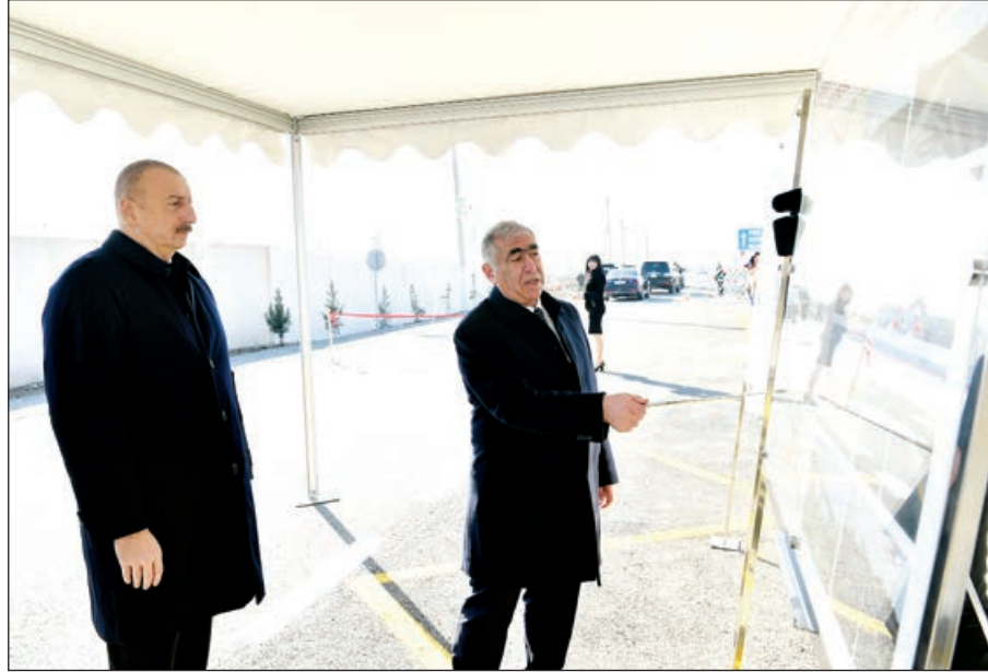
Əvvəli 1-ci səh.

İkinci yol layihəmiş 37 kilometr uzunluğunda Karrar-Böyük Kəngərli yolu olub. Bu yol 7 yaşayış məntəqəsinin 6 min əhəlisinə xidmət edir. Bu da 70-80 il torpaq yol olub, nə asfalt, nə də çınqıl örtüyü olmayıb. Ötən əsrin 60-cı illərində tikilmiş körpünü də bərpa etmişik.