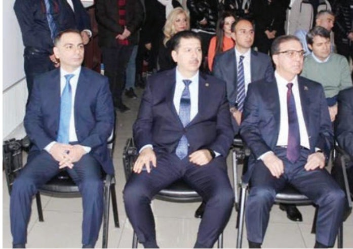
Əsasını qoyub, güclü dövlət yaradıb. Möhz Atatürkün söyi və təşəbbüsü ilə 29 oktyabr 1923-cü ildə Türkiyə cümhuriyyəti elan olunub. Dahi şəxsiyyətin apardığı bir sıra islahatlar nəticəsində ölkə sürətlə inkişaf edib. Bu gün türk xalqı böyük Atatürkün miras qoyduğu ideyaları həyata keçirir.

Məruzəçi onu da qeyd edib ki, Mustafa Kamal Atatürk Azərbaycan xalqının qəlbində böyük iz buraxıb. Ulu Öndər Heydər Əliyev Atatürk haqqında demişdir: "Mustafa Kamal Atatürk bütün türk dövlətlərinin tarixi şəxsiyyətidir. Bütün türk dünyasının əvəzsiz, ölməz lideridir. Atatürkün hələ o zamanlar "Azərbaycanın sevinci sevincimiz, kədəri kədərimizdir" deməyi bu iki dövlətin bir-birinə olan qarışıqlıq əlaqələrini daha da möhkəmləndirmişdir".