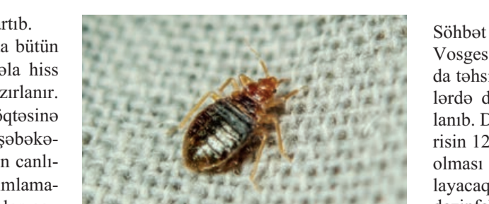
Fransa Səhiyyə Nazirliyinin rəhbəri Orellan Russo vətəndaşları paytaxtın bit-

lər tərəfindən zəbt edilməsi ilə bağlı təşviş yaratmamağa çağırır. Bir neçə aydan sonra Paris Olimpiya Oyunlarına evsahibliyi edəcək və bu cür "reklam" ölkənin imicinə ciddi ziyan vura bilər.