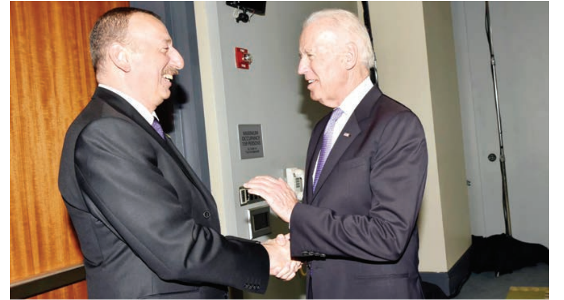
Əvvəli 1-ci sah.

Azərbaycan Prezidentinin yürütdüyü diplomatiya beynəlxalq birlik tərəfindən təqdir edilir