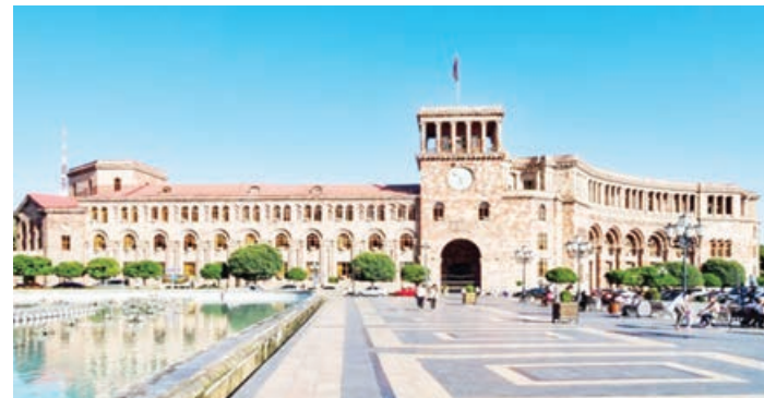
bağlı bildirib: "Ermənistanın keçmiş prezidenti S.Sarkisyan 10 illik prezidentliyi dövründə dəfələrlə dövlət hesabına və hökumət təyyarəsi ilə Almaniyanın məşhur Baden-Baden kurortuna səfər edib. Sarkisyan bu kurort şəhərində 10 ildə 16 dəfə olub". Saytın yazdığına görə, bu səfərlərdən biri də 2016-cı ilin dördüncü müharibəsindən dərhal sonra olub. Təhqiqatçıların iddiasında qeyd edilir ki, Serjikin hamın ilin 6-7 aprelində Almaniyaya rəsmi səfərindən də Baden-Badene baş çəkmək üçün istifadə edib.

Ümumiyyətlə, S.Sarkisyan prezident olduğu 10 il ərzində Baden-Badene 16 dəfə səfər etdiyi barədə iddialar səslənir. "Fip.am" jurnalist təhqiqatı saytı məsələ ilə