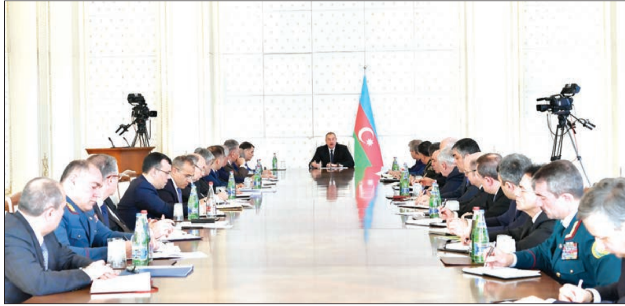
Möhtərəm cənab Prezident, 2018-ci ildə keçirilmiş seçkilərdə əhalinin mütləq əksəriyyətinin etimadını yenidən qazanaraq Prezident seçildikdən sonra imzaladığı yeni fərman da şəhid ailələri ilə bağlı növbəti humanist addımınıza və digər məlumatlara birbaşa çıxış imkanı yaradıb, şəffaflığı və ictimai açıqlığı təmin edib.

“E-sosial” portalı ölkəmizdə ilk dəfə olaraq sosial reystrini formalaşdırıb, vətəndaşlara əmək müqavilələri, məşğulluq, pensiya kapitalı, mənzil və avtomobil növbəsi, əlillik, reabilitasiya və digər məlumatlara birbaşa çıxış imkanı yaradıb, şəffaflığı və ictimai açıqlığı təmin edib.