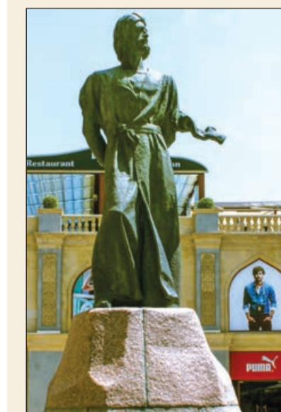
Böyük şair və mütəfəkkir Seyid Əli Seyid Məhəmməd oğlu İmadəddin Nəsimi 1369-cu ildə Şamaxı şəhərində anadan olmuşdur.

lik təhsilini Şamaxıda alaraq, dövrün elmlərini öyrənən şair klassik Şərq və qədim yunan fəlsəfəsini, ədəbiyyatını dərin-dərin mənimsəmiş, islamın və xristianlığın əsaslarına yaxından bələd olmuş, tibb, astronomiya, astrologiya, riyaziyyat və məntiq elmlərinə yiyələnmişdir.