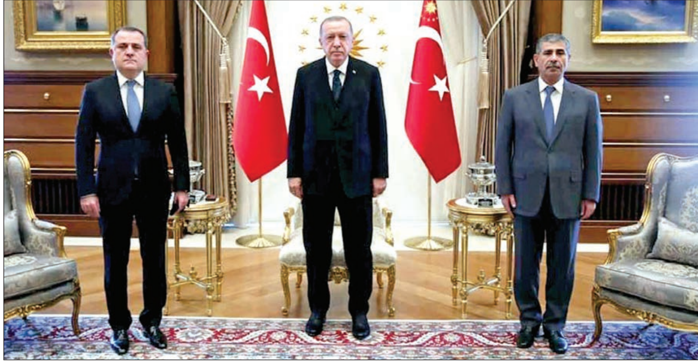
Türkiyə Respublikasının Prezidenti Rəcəb Tayyib Ərdoğan avqustun 11-də Azərbaycan Respublikasının Xarici İşlər naziri Ceyhun Bayramov və Müdafiə naziri Zakir Həsənovu qəbul edib.