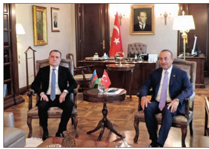
Nazir Ceyhun Bayramov Ermənistan Azərbaycanın Ermənistan dövlət sərhədinin Tovuz rayonu istiqamətində törətdiyi sonuncu tərxi-batdan danışıqda Türkiyə dövlətinin hər zaman olduğu kimi Azərbaycanın haqq mövqeyinə nümayiş etdirdiyi dəstəyi məmnunluqla qeyd edib. Ermənistan-Azərbaycan münasibətlərində beynəlxalq hüququn norma və prinsipləri, xüsusilə də dövlətlərin suverenliyi, ərazi bütövlüyünə hörmət və beynəlxalq sərhədlərin toxunulmazlığı əsasında həllinin vacibliyini vurğulayıb.

Tərəflər ikitərəfli gündəlikdə duran bir çox sahələrdə, o cümlədən siyasi, iqtisadi, ticarət, humanitar, mədəniyyət, təhsil və digər sahələrdə əməkdaşlıq münasibətlərinin inkişafından məmnunluq bildirib və bu əlaqələrin daha da genişləndirilməsi perspektivlərini müzakirə ediblər. İki ölkə arasında mövcud əməkdaşlığın həm ikitərəfli, həm də çoxtərəfli formatlarda bundan sonra da davam etdiriləcəyindən əminlik ifadə olunub.