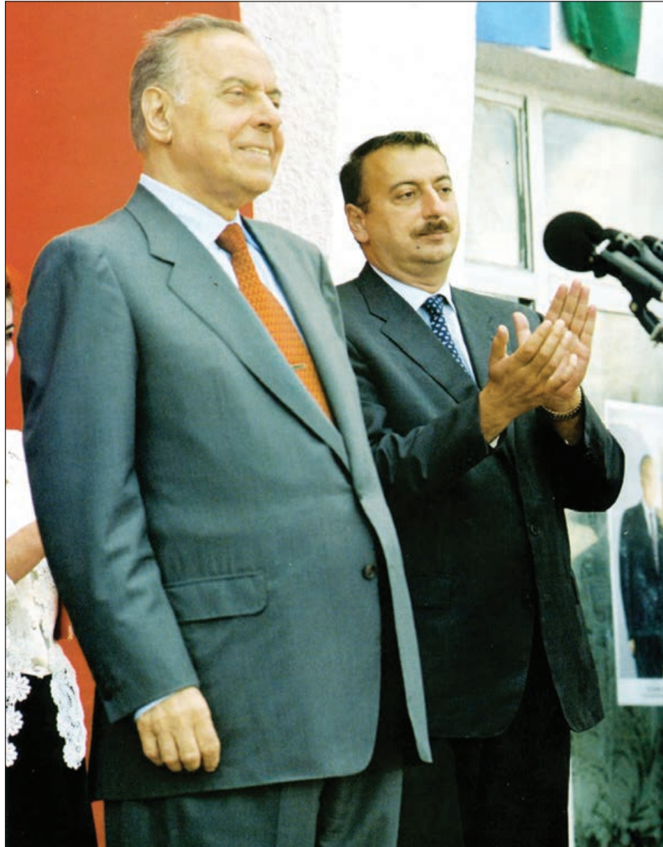
Əvvəlki 2-ci sah.

Qısa müddət ərzində qazanılan böyük uğurlar Sovet İttifaqı miqyasında da diqqətli cəlb etmiş və Azərbaycan rəhbərinin şəxsiyyətinə marağı artırmışdı. Təsədüfi deyil ki, Heydər Əliyev 1976-cı ildə daha yüksək siyasi statusa layiq görülərək SOV İKP MK Siyasi Bürosunun üzvlüyünə namizəd seçilmişdi. Bu isə onu bir sıra digər müttəfiq respublikaların başçılarından fərqləndirirdi. Ulu Öndər sonralar bildirdi ki, o, bu üstünlükdən öz xalqının menafeyi üçün zərərli istifadə etmişdir: "SSRI Nazirlər Sovetindəki əlliye yaxın nazirdən hansı-