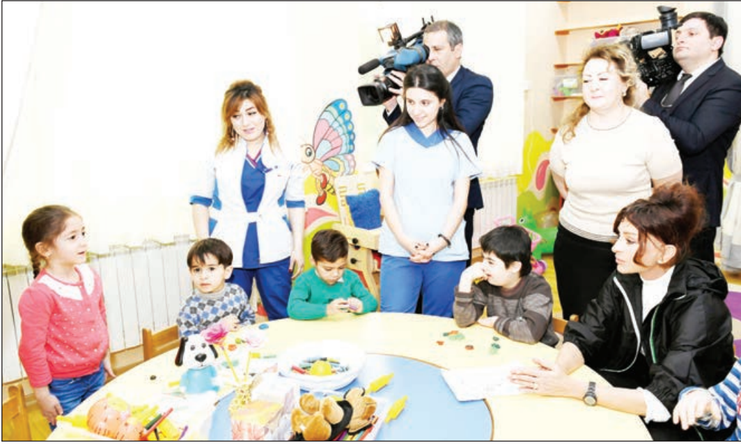
Əvvəli 1-ci səh.

Ölkəmizdə sağlamlıq imkanları məhdud olan uşaqların tibbi və sosial reabilitasiyasını gücləndirməsi istiqamətində mühüm addımlar atılır. Dövlət sağlamlıq imkanları məhdud uşaqların çoxsaylı sosial proqramlara, o cümlədən reabilitasiya, pulsuz istirahət və texniki-bərpa təminat proqramlarına cəlb olunmasını həyata keçirir. Mərkəzdə yaradılan şərait də bunu bir daha təsdiq edir. Xüsusi qayğıya ehtiyacı olan balacalar Mehriban Əliyeva ilə söhbət edərək bacarıqlarını nümayiş etdirdilər. Uşaqlar Heydər Əliyev Fondunun prezidentinə sevimli oyunlarından, oxuduqları mahnılardan danışdılar. Heydər Əliyev Fondunun prezidenti Mehriban Əliyevaya müəssisənin həyatında inşa edilən akt zalı haqqında da məlumat verdi.