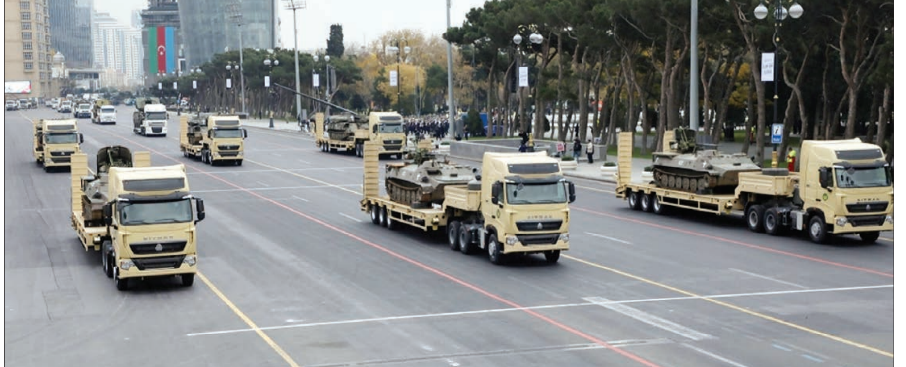
Əvvəl 5-ci səh.

Azadlıq meydanına 44 günlük Vətən müharibəsində düşməndən qənimət götürülmüş hərbi texnikaların bir qismi gətirildi. Vətən müharibəsi zamanı Azərbaycan Silahlı Qüvvələrinin işğaldan azad olunan ərazilərdə ermənilərdən qənimət götürüldüyü və sıradan çıxardığı 2 mindən çox avtomobilin nömrə nişanlarından hazırlanan kompozisiya paradda nü-