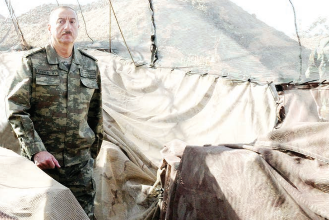
Əvvəlki 1-ci sah.

İlham Əliyevin şəxsində xalqımızın və dövlətimizin zəfərini belə təsnifatlaşdırmaq olar: