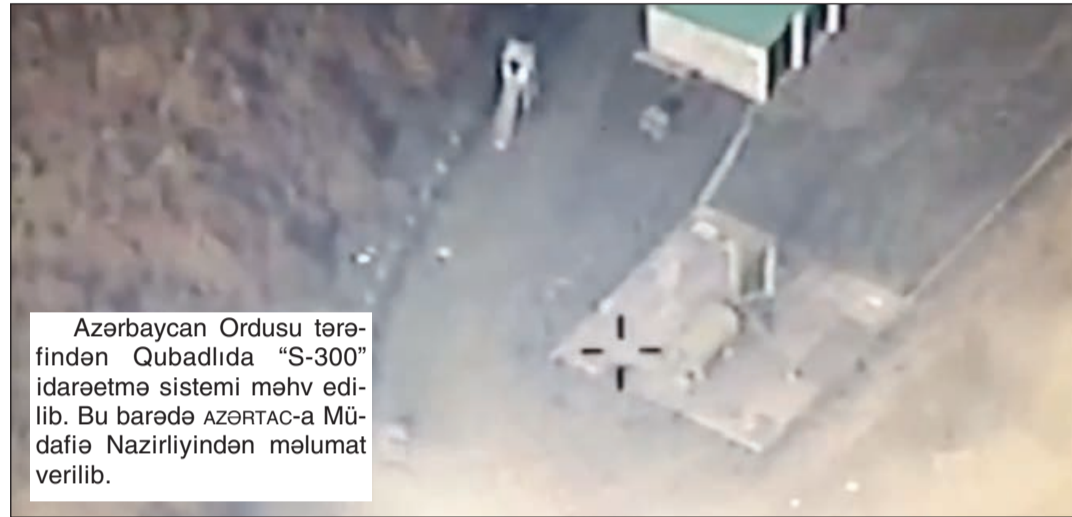
Azərbaycan Ordusu tərəfindən Qubadlıda "S-300" idarəetmə sistemi məhv edilib. Bu barədə AZƏRTAC-a Müdafiə Nazirliyindən məlumat verilib.