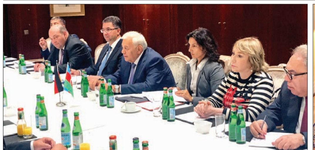
Əvvəli 1-ci səh.

Bundestaqda keçirilmiş görüşdə, həmçinin Bakı və Berlin şəhərləri arasında əməkdaşlıq imkanları müzakirə edilmiş, paytaxt şəhərləri arasında turizm, təhsil, vətəndaş cəmiyyəti əlaqələrinin