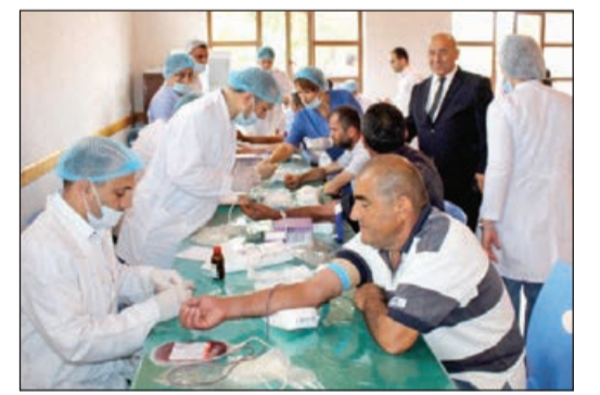
Aksiya zamanı yığılan qan nümunələri Lənkəran Regional Qan Bankına təhvil veriləcək.

Mərkəzi Qan Bankının Lənkəran Bölməsinin və Masallı Rayon Mərkəzi Xəstəxanasının həkim və tibb işçiləri tərəfindən qan verməyə gələn sakinlərin sağlamlığı əvvəlcədən yoxlanılıb.