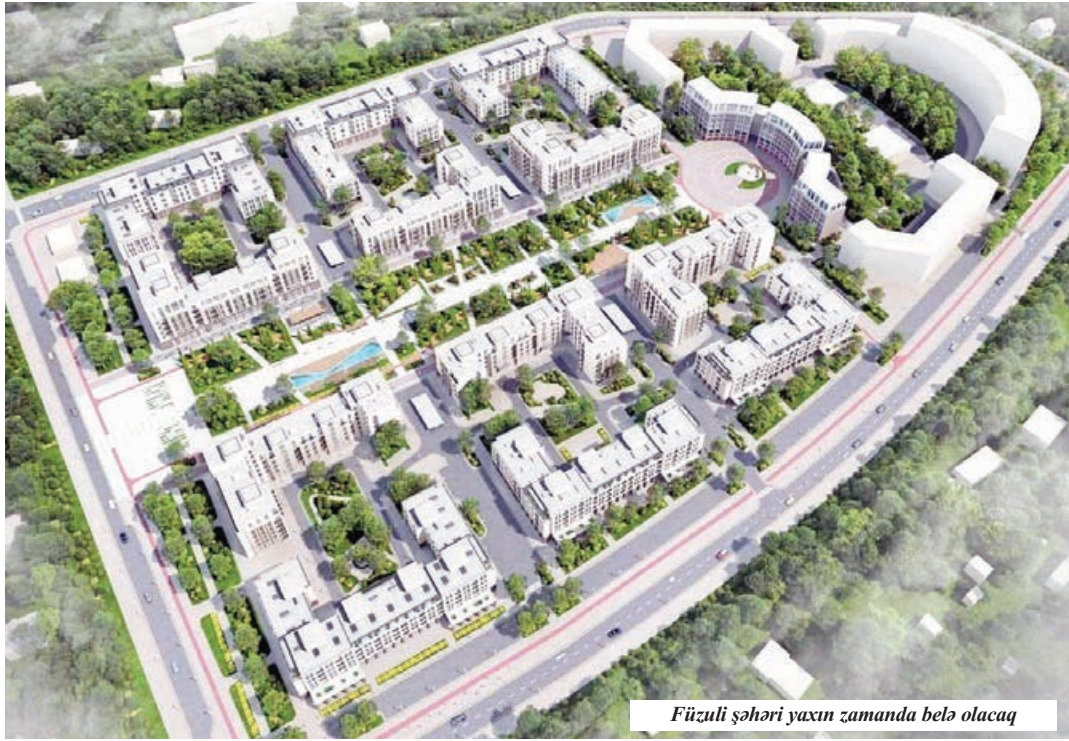
Füzuli şəhəri yaxın zamanda belə olacaq

Bu, təbii. Çünki 44 günlük Vətən müharibəsinin ardından işğaldan azad edilmiş ərazilərimizə Böyük Qayıdışın təmin olunmasının dövlətin əsas prioriteti olduğunu onlar yaxşı bilirlər. Bilirlər ki, Qarabağda və Şərqi Zəngəzurdə yeni infrastrukturun qurulması, evlərin tikilməsi, yolların və digər kommunikasiya sistemlərinin yaradılması ilə genişmiqyaslı işlərə start verilib. Onu da görürlər ki, qısa zaman kəsiyində dağıdılmış, yerliyəsalınmış olumşu şəhərlərin, kənd və qəsəbələrin yenidən qurulması, yeni binaların, "ağıllı kənd" və hava limanlarının tikilməsi Böyük Qayıdışın başlanğıcıdır. Artıq, daha dəqiq