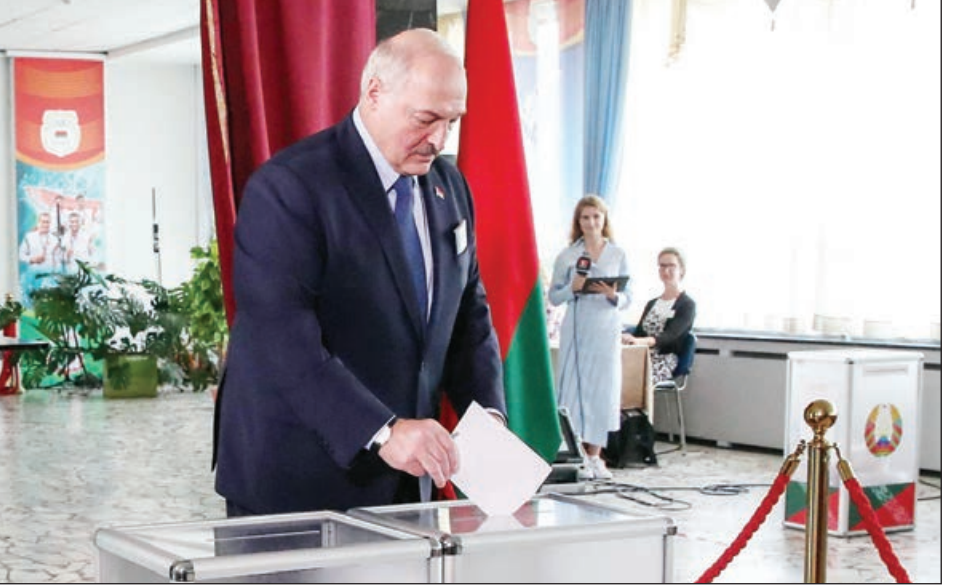
Belarusda prezident seçkiləri zamanı Lukaşenko rəqiblərindən üstün olduğunu nümayiş etdirir.

Belarusda srağagün keçirilmiş növbəti prezident seçkiləri, bir sıra müşahidəçilərin proqnozlarının əksinə olaraq, yeni dövlət başçısının adının elan olunması ilə yadda qalmadı. 1994-cü ildən bəri ölkəyə rəhbərlik edən Aleksandr Lukaşenko bir daha rəqiblərindən üstün olduğunu nümayiş etdirdi və Prezident kürsüsünü qoruyub saxladı.