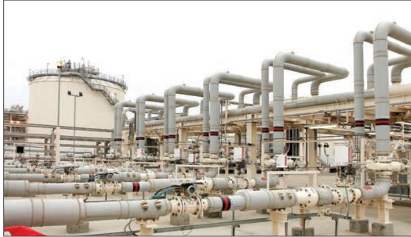
kubmetrinin isə Avropaya ixracı nəzərdə tutulub.

Xatırladaq ki, "Şahdəniz-2"dən çıxarılaacaq illik 16 milyard kubmetr mavi yanacaq həcminin 6 milyard kubmetrinin Türkiyəyə, 10 milyard