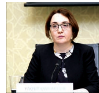
"Bugünkü statistika görə, yoluxanların sayı ilə sağalanların sayının eyniləşdiyini demək olar. Yoluxanlarla sa-

ğalanların sayı arasındakı kəskin fərq azalmağa doğru gedir. Bu onu deməyə imkan verir ki, bəlli bir sabitləşməyə nail ola bilməyəcək".