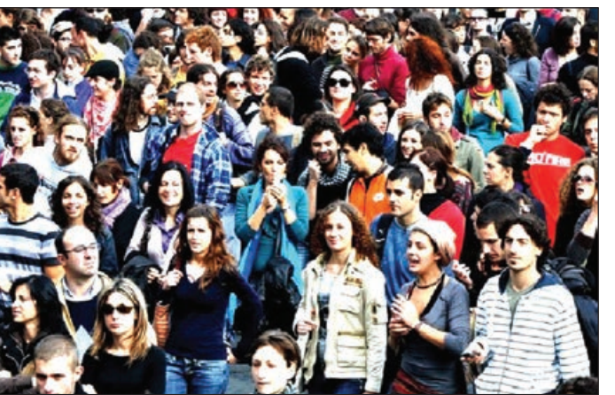
Nikah və boşanmalar

BMT-nin tələblərinə görə, ölkənin əhalisi o zaman qoca sayılır ki, 60 və daha yaşlı insanların sayı əhalinin ümumi sayına nisbətən 12 faiz və daha çox təşkil edir. Bu hal cəmiyyətin iqtisadi yükünü artırır.