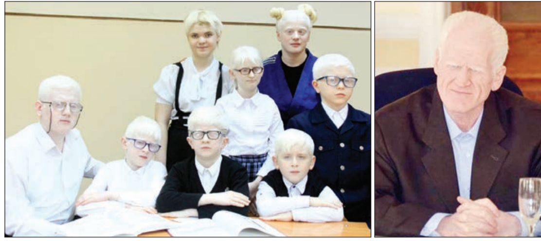
◆ Bizlərdən biri