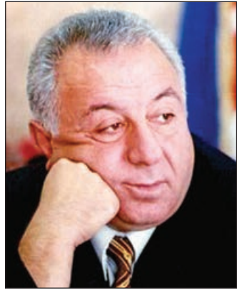
Üvvəli 1-ci səh.

Azərbaycan Prezidenti seçilərkən cənab İlham Əliyevin cəmi 42 yaşında və o, bu yaşda dünyanın ən gənc dövlət başçılarında sayılırdı. O gündən keçən 18 il ərzində İlham Əliyev əslində lider böhranının yaşadığı müasir dünyamızda öz şəxsi nümunəsi ilə yeni dövrün əsl liderini, kamill dövlət adamının mükməmmal obrazını yaratdı.