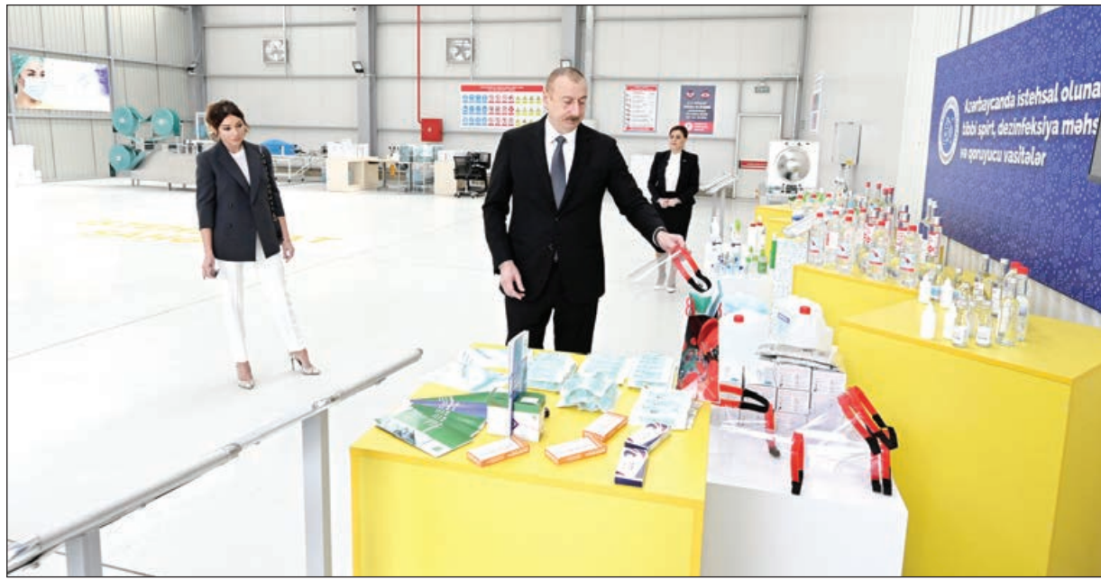
Əvvəlki 4-cü sah.

Tibbi maska istehsalı üçün Türkiyədən gətirilmiş müasir avadanlıq qısa müddətdə quraşdırılıb. Müəssisənin yaradılması üçün investisiya xərcləri 3,9 milyon manat təşkil edib. Müəssisədə 30-dan çox yeni iş yeri yaradılıb. İstehsal prosesi üç növbəlidir. Tibbi maskaların istehsalı müəssisəsində ISO beynəlxalq standartlarına uyğun xammaldan birinci mərhələdə gündəlik 120 min tibbi maska istehsal ediləcək. Qeyd edək ki, maskalar qablaşdırılmadan öncə xüsusi avadanlıqla əlavə sterilizasiya olunur. Yaxın günlərdə daha bir istehsal xətti qurulacaq və ikinci mərhələ çərçivəsində istehsal həcmi 2 dəfə artırılaraq gündəlik istehsal 200-250 min tibbi maskaya çatdırılacaqdır. Müəssisənin məhsulları ilkin olaraq daxili bazarda tələbatı ödəməyə yönəldiləcək.