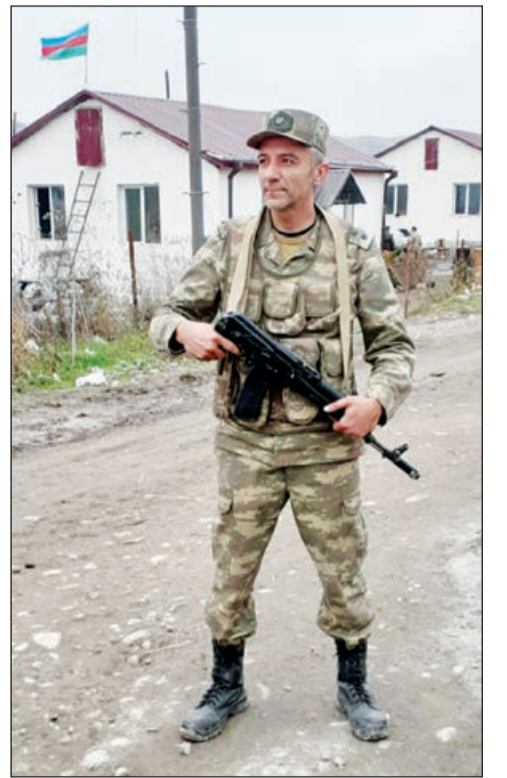
3 gün orda qaldım. Dekabrın 25-də isə tərxis olundum.

Erməni tərəfinə bizim sərhədləri tərək etmək üçün dekabrın 20-nə qədər vaxt vermişdilər. Amma 18-ində çixdılar. 2 gün PUA-ların müşayiətilə həmin ərazilər minaalardan təmizləndi. Hardasa 400-ə qədər mina tapıldı. Hətta bir neçə gün öncə ordada iki erməni öz basdırıqlarını minaya düşmüşdü. Dekabrın 21-də Qafana gətdik. Dağlıq qanaylı ərazi idi. Bir çay axırdı. Yer doluydu canavar ləpirləriylə. Qayalar arasında qartallar uçurdu. Ucaq bir yer idi. Şəbəkə tutmurdu. Postumuzun qurduq,