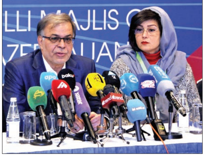
“Seçkiləri müşahidə etmək üçün 8 mntəqədə olduq. Mntəqələrdə heç bir qanun pozuntusu müşahidə

İƏT nümayəndəsi: “Seçkilərin uğurla keçməsinə Azərbaycandakı demokratik mühit əhəmiyyətli dərəcədə təsir edib”