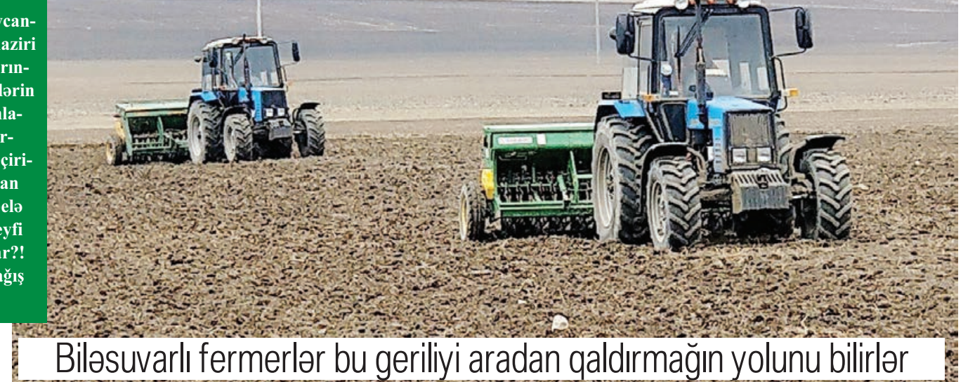
Biləsuvarlı fermerlər bu geriliyi aradan qaldırmağın yolunu bilirlər

Burada M.Ə.Sabirin məşhur "Yağmadı yağış, bitmədi bir dana, nə borcum?!" beyti yada düşür. Yaxud "Yağmadı yağış, bitmədi qamış" deyimini götürək. Bu ifadələrin yaranmasından görünür nəçə il keçib. Lakin bu ötən dövrdə elm, texnika, texnologiya nə qədər inkişaf etsə də, təbiətdən asılılığımız hələ də qalmaqdadır və çox güman ki, həmişə də belə olacaq. Təbiətlə bağlı hazırkı vəziyyət, yaranan durum isə ürəkəcan deyil. Bu əsasən arana - taxıl və pambıq ekib- becərən bölgələrimizə, o sıradan Biləsuvar rayonuna da aiddir. Cari ilin yazı pambıqçılıq üçün, demək olar ki, əlverişsiz keçdi. Aprel, may aylarında havaların soyuq olması yaz tarla işlərinin ləngitdi və buna görə də fermerlər, torpaq mülkiyyətçiləri təkrar çiyid səpinə aparmaq məcburiyyətində qaldılar. Nəticədə pambığın yetişməsi 10-15 gün gecikdi. Yeni əvvəlki illərdə yığıma avqustun sonu,