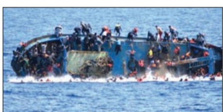
Qurbanların yarısından çoxu Afrikadan Avropaya Aralıq dənizi ilə miqrasiya marşrutunun payına düşür (2297). Şimali Afrikada 567, Afrikanın Saxaranın cənubunda yerləşən ölkələrində 559,

Təşkilatın rəsmi nümayəndəsi Leonard Doyl Cenevrədə keçirilən brifinqdə bildirmişdir ki, əldə olunan məlumata görə, azı 4592 miqrant yolda həlak olmuş, yaxud itkin düşmüşdür. Doylun dediyinə görə, qurbanların sayının hesablanması hələ başa çatmamışdır. Belə ki, hələ bir neçə mənbədən məlumatlar daxil olmuşdur.