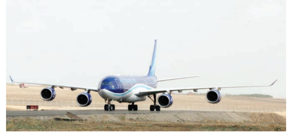
Əvvəlki 1-ci sah.

Zəngilan Beynəlxalq Hava Limanına ilk təyyarəmiz uğurla eniş etdi