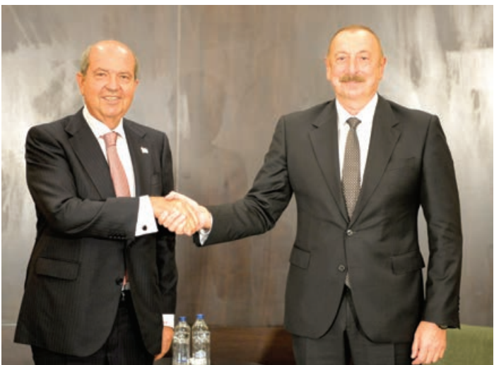
Azərbaycan Respublikasının Prezidenti İlham Əliyev avqustun 9-da Konyada Şimali Kipr Türk Respublikasının Prezidenti Ersin Tatarı qəbul edib.

AZƏRTAC xəbər verir ki, görüşdə türk dünyasında xalqlar arasında əlaqələrin möhkəmlənməsi üçün xidmət edən V İslam Həmrəyliyi Oyunlarının Türkiyədə keçirilməsinin önəmi vurğulandı. Bu mötəbər beynəlxalq idman tədbirinin Bakıda da yüksək səviyyədə təşkil olunduğu məmnunluqla qeyd edildi.