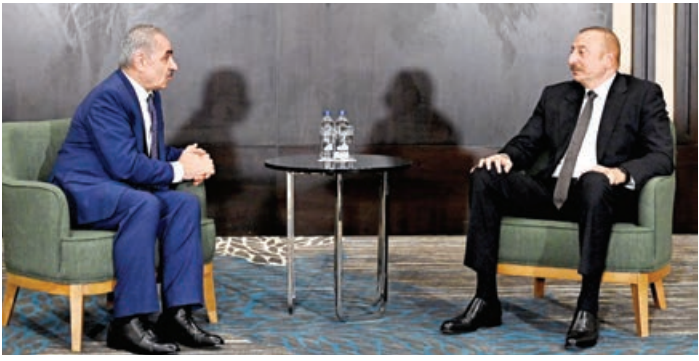
Azərbaycan Respublikasının Prezidenti İlham Əliyev avqustun 9-da Konyada Fələstin Dövlətinin Baş naziri Mohammed Ştayehi qəbul edib.

AZƏRTAC xəbər verir ki, Mohammed Ştayeh Fələstin Dövlətinin Prezidenti Mahmud Abbası salamlarını Prezident İlham Əliyevə çatdırdı.