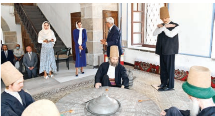
Azərbaycan Respublikasının Birinci vitse-prezidenti Mehriban Əliyeva və Heydər Əliyev Fondunun vitse-prezidenti Leyla Əliyeva avqustun 9-da Türkiyənin Konya şəhərində Mövlanə muzeyini ziyarət ediblər.