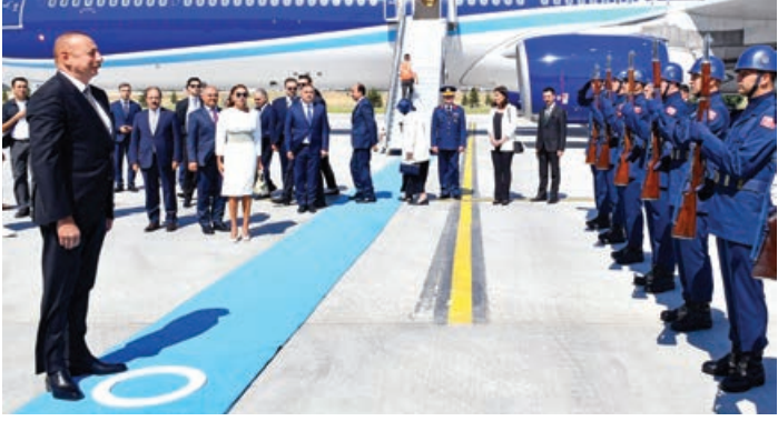
Avqustun 9-da Azərbaycan Respublikasının Prezidenti İlham Əliyev Türkiyə Respublikasının Prezidenti Rəcəb Tayyib Ərdöğannın dövlətə ilo Türkiyəyə işğuzar səfəro gedib.

AZƏRTAC xəbər verir ki, hər iki ölkənin Dövlət bayraqlarının dalğalandığı Konya şəhərinin hava limanında dövlətimizin başçısının səfərinə fəxri qarovul dəstəsi düzülüşdü.