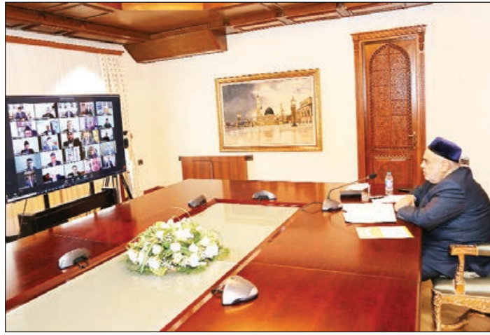
Aprəlin 9-da Qafqaz Müsəlmanları İdarəsində (QMI) Qazılar Şurasının növbəti iclası keçirilib.

İdarənin Mətbuat xidmətindən AZƏRTAC-a verilən məlumata görə, QMI-nin sədri Şeyxülislam Allahşükür Paşazadənin sədrliyi ilə onlayn formada keçirilən iclasda Ramazan ayının başlanması ilə əlaqədar fətva müzakirə olunub.