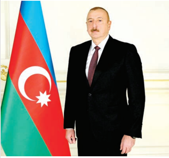
Prezident İlham Əliyev rəsmi "Facebook" səhifəsində Beynəlxalq Qadınlar Günü münasibətilə paylaşım edib.