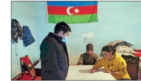
onlara alınır. Bunun üçün yaxın vaxtlarda onlara aktivlər verilecək.