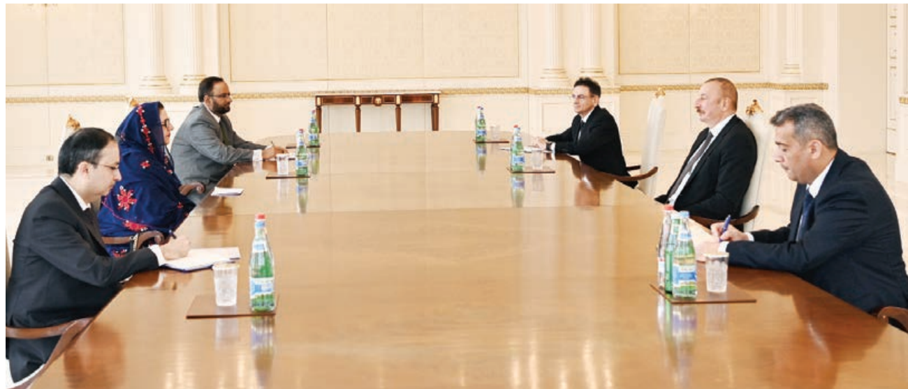
Prezident İlham Əliyev Vətən müharibəsi dövründə Pakistanın Azərbaycanı ədalətli mövqeyinə verdiyi davamlı dəstəyə və qardaş mövqeyinə görə bir daha minnətdarlığını bildirdi və Azərbaycan xalqının bunu yüksək qiymətləndirdiyini vurğuladı.

Prezident İlham Əliyev Bakıda keçiriləcək Azərbaycan-Pakistan Birgə Komissiyasının işinə toxunaraq bu tədbirin iqtisadi əməkdaşlığın genişlənməsi, ticarət dövryyəsinin həcminin artırılması, biznes dairələri arasında əlaqələrin səviyyəsinin qaldırılması işinə xidmət edəcəyinə əminliyini ifadə etdi. Dövlət başçısı investisiya qoyuluşu üçün prioritetlərin müəyyənləşdirilməsinin zərurətini də vurğuladı.