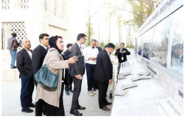
Əvvəli 1-ci sahə.

Oktyabrın 31-də festival çərçivəsində Şuşada TÜRKSÖY-a üzv ölkələrin dövlət teatr rəhbərləri surasının 9-cu toplantısı keçirilib. Toplantıda TÜRKSÖY-a üzv ölkələr - Azərbaycan, Qazaxıstan, Qırğızıstan, Özbəkistan, Türkiyə, Türkmənistan, Şimali Kipr Türk Cümhuriyyəti və Qaqauz Yeri (Moldova) Dövlət teatrlarının rəhbərləri iştirak ediblər.