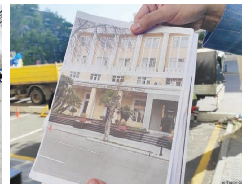
Dövlət tərəfindən yaşllaşdırma tədbirləri görüldür, amma bəziləri...

Deputatın fikrincə, təbiətə münasibəti hüquqi norma ilə yanaşı, əxlaq normasına çevrilməlidir. Bu-hər hektarından bir ildə insan üçün xeyirli olan 30 kiloqrama qədər efir yağı buraxılır. Yaşıl massiv-