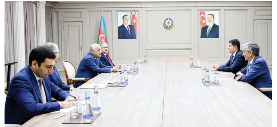
Bakıda Azərbaycan ilə Tacikistan arasında ticarət-iqtisadi əməkdaşlıq məsələləri üzrə birgə Hökumətlərarası Komissiya-sının 6-cı iclasının keçirilməsi-nin əhəmiyyəti qeyd edilib.

Tərəflər iki ölkə arasında iqtisadi-ticarət, investisiya, mədəni-humanitar sahələrdə qarşılıqlı fəaliyyəti nəzərdən keçiriblər.