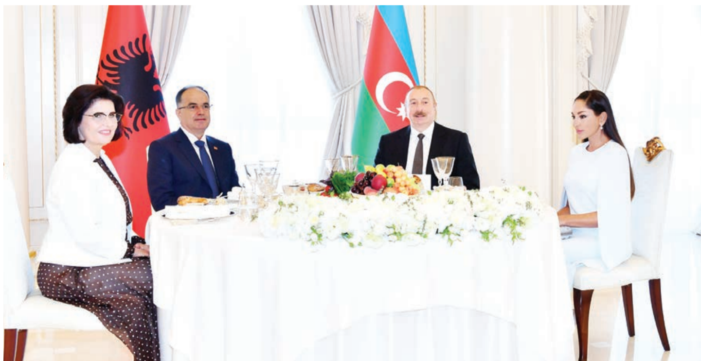
İyulun 7-də Azərbaycan Respublikasının Prezidenti İlham Əliyevin və birinci xanım Mehriban Əliyevanın adından Albaniya