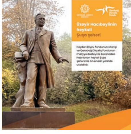
Üzeyir Hacıbəylinin heykəli Şuşada

Ali Baş Komandan İlham Əliyevin rəhbərliyi ilə müzəffər ordumuzun şanlı qələbəsindən sonra işğaldan azad olunan ərazilərdə tarixi abidələrimizin, o cümlədən görkəmli şəxsiyyətlərimizin heykəllərinin bərpası və yenidən qurulmasına başlanılıb.