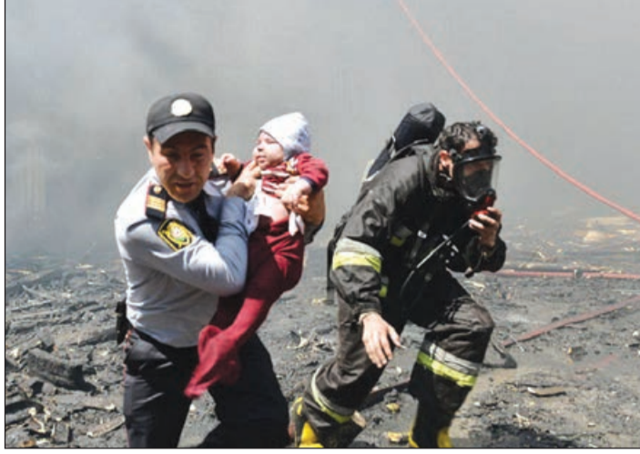
Azərbaycan polisi hər cür ekstremal şəraitdə fədakarlığa hazır olduğunu daim sübut edir

1993-cü ilin 15 iyununda xalqın təkidli tələbi ilə hakimiyyətə qayıdan ulu öndər Heydər Əliyev cəmiyyətin hava və su kimi əhliyə duydugu sabitliyi bərqərar etmək üçün sınaqlardan alınacaq çixan, müstəqilliyin dəyərini dərk edən daxili işlər orqanlarına arxalandı. Azərbaycan polisi xalqa layiqli xidməti ilə dövlət quruculuğu prosesində öz möhkəm, sarsılmaz, şərəfli yerini tutdu. Onların uzun illərdən bəri topladıqları zəngin sənədlər, eiləce də müstəqilliyin ilk illərində formalaşmış təcrübə, əvvəlki iqtidarların səhvlərindən, yanlışlıqlarından çıxarılan dərslər Heydər Əliyevin