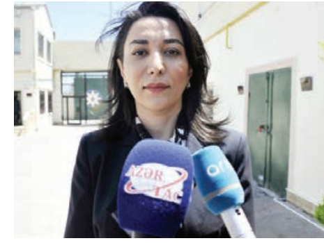
O, qeyd edib ki, "Məhkum edilmiş bir sıra şəxslərin əfv olunması haqqında" sərəncam ümumilikdə 213 şəxsə şamil olulmuşdur.

"Müstəqillik Günü ərəfəsində Ali Baş Komandan İlham Əliyev sayca 68-ci əfv sərəncamını imzalayıb. Ulu Öndər Heydər Əliyev tərəfindən insan hüquq və azadlığına göstərilən həssas münasibət və humanizm siyasəti bu gün Prezident İlham Əliyev tərəfindən uğurla həyata keçirilir".