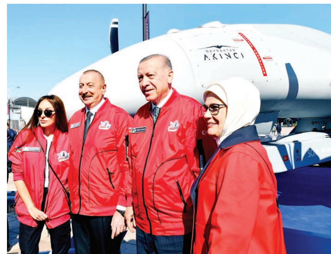
Əvvəli 3-cü sah.

Çıxışlardan sonra festivalın müxtəlif müsabiqələr üzrə qaliblərinin mükafatlandırma mərasimi oldu.