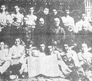
Газах Мүаллимлар Семнаркестер мүаллими үзүлөбөрүндөн бир групу. Шикла 1924-чү илде чокимшлар.