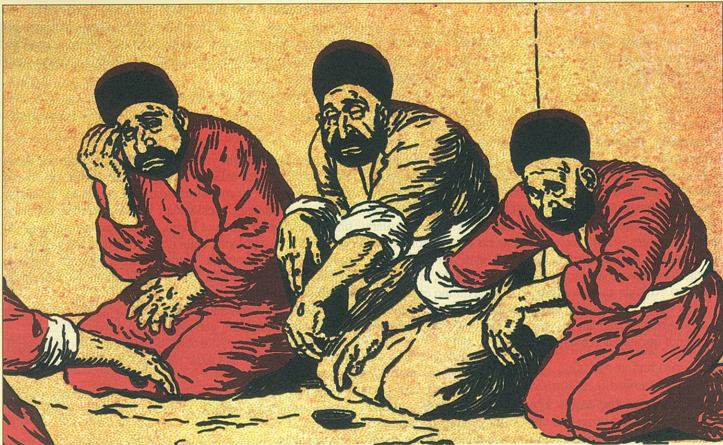
Dastəmaz alanda bu yekəlikdə