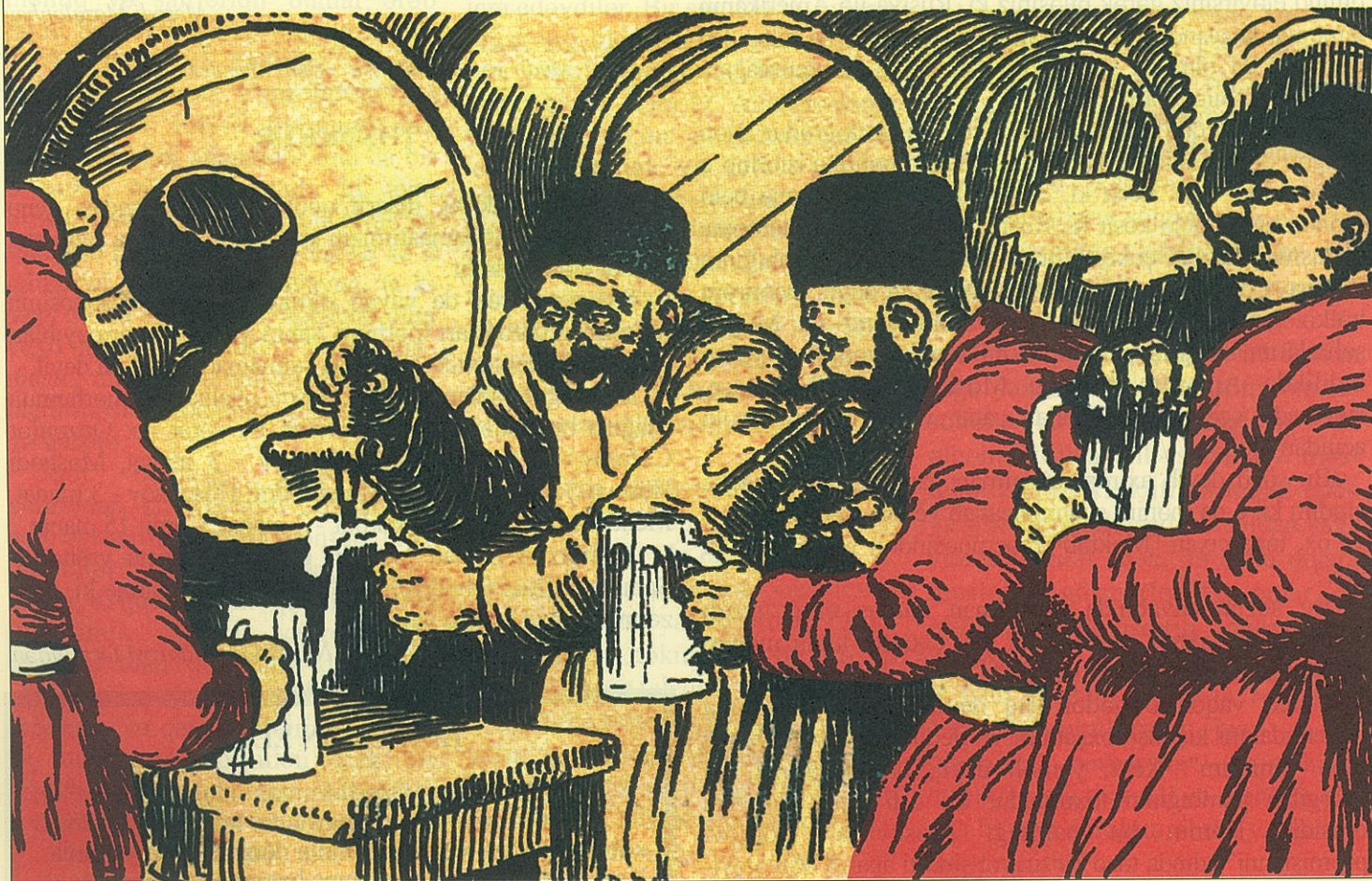
Çaxır içəndə bu yekəlikdə