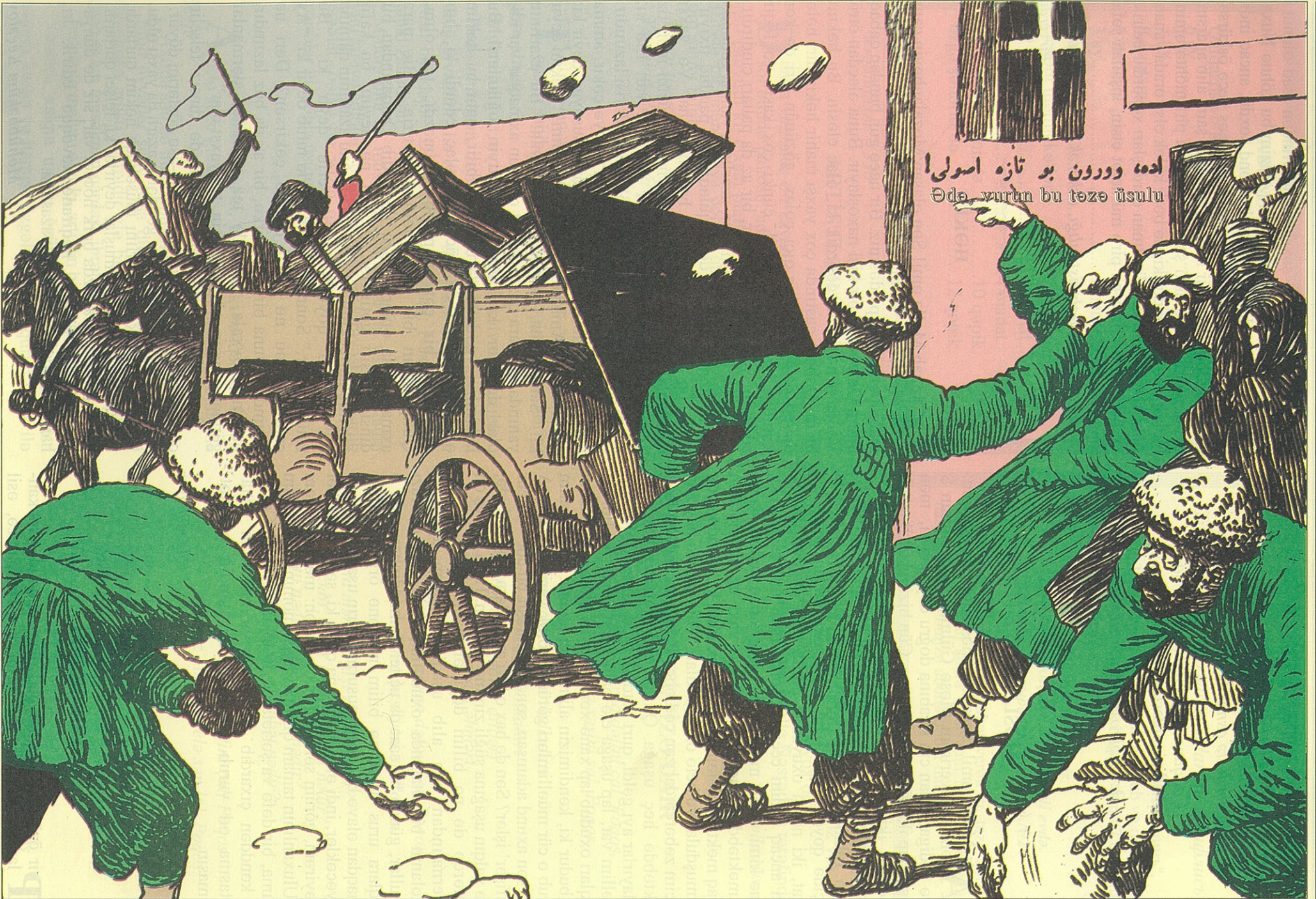
Bakı quberniyasında Türkan kəndində təzə üsul ilə açılan məktəbin şeyləri.