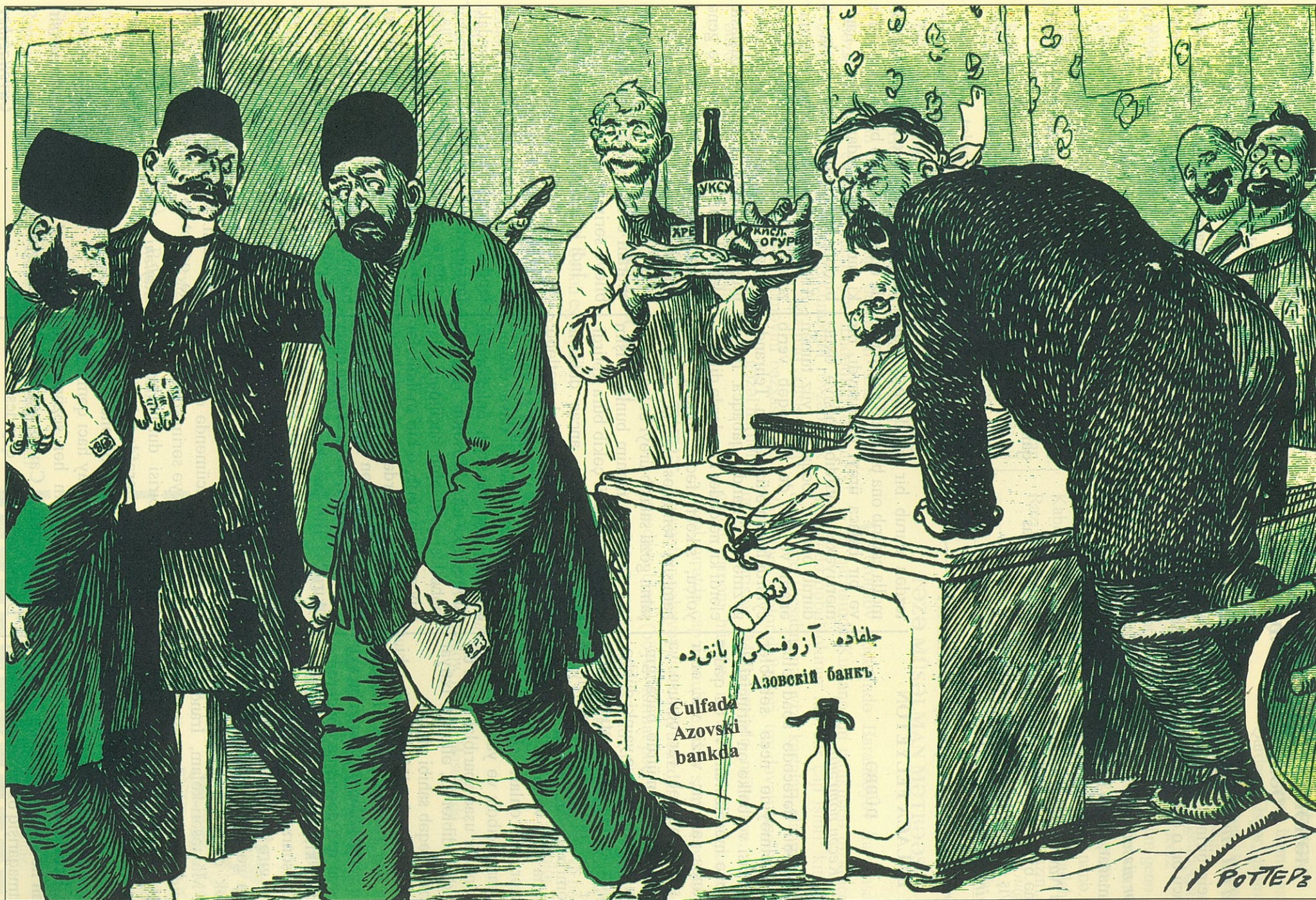
“Uxodite, papaхski tatar!” “Уходите, папахские татары!”