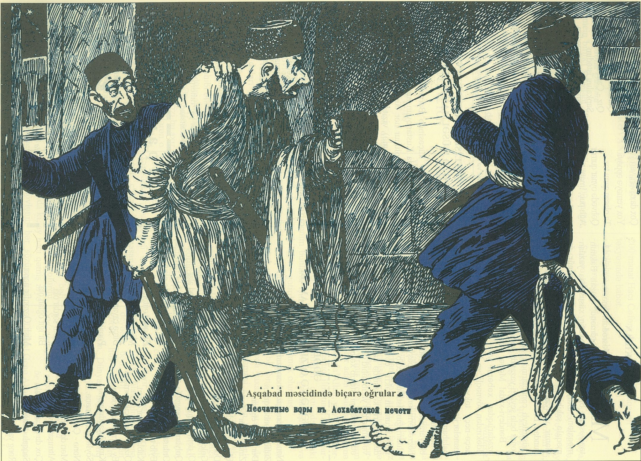
Aşqabad məscidində biçarə ögrular Несчастные воры в Ашхабатской мечети