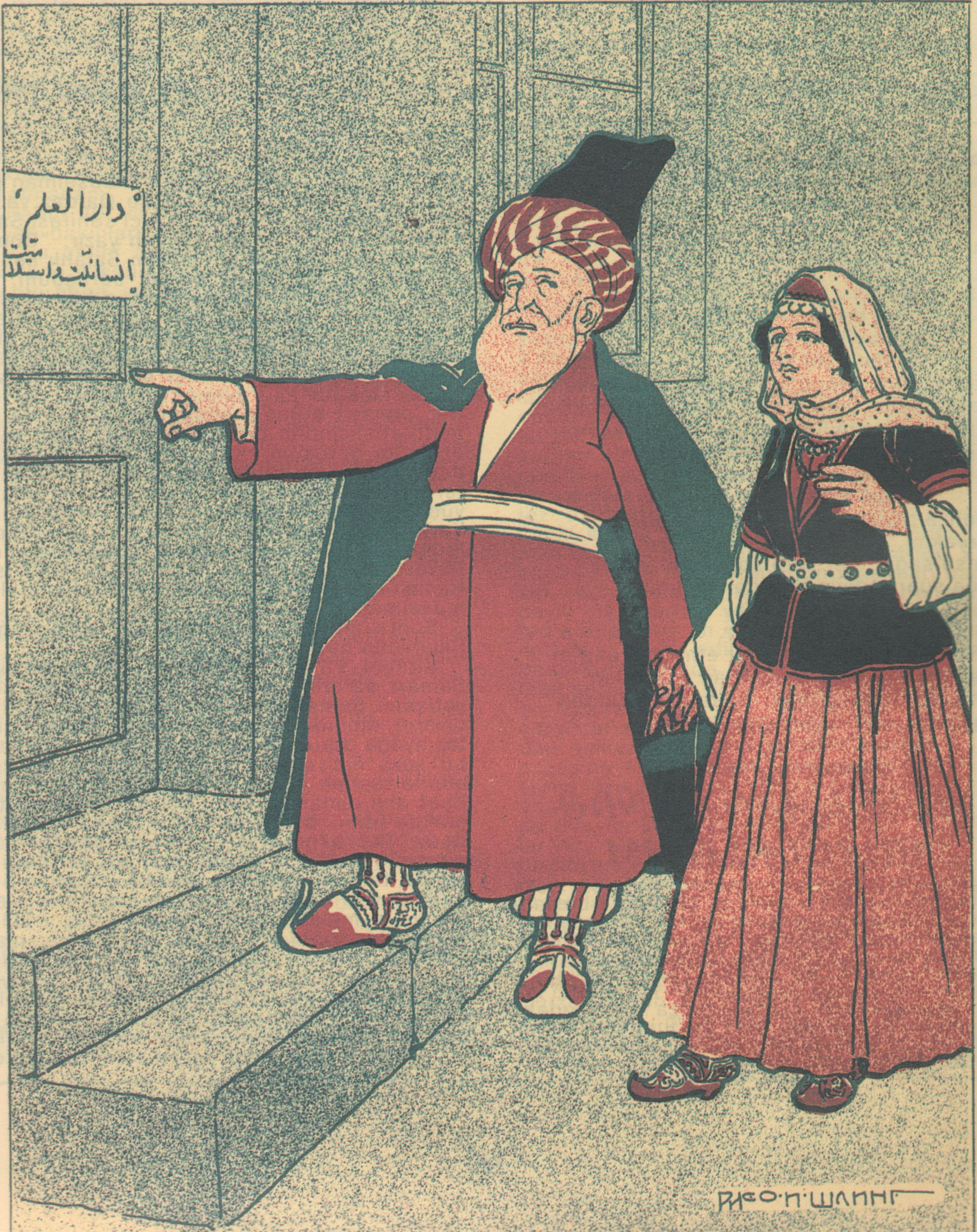
Рис. П. Шалин