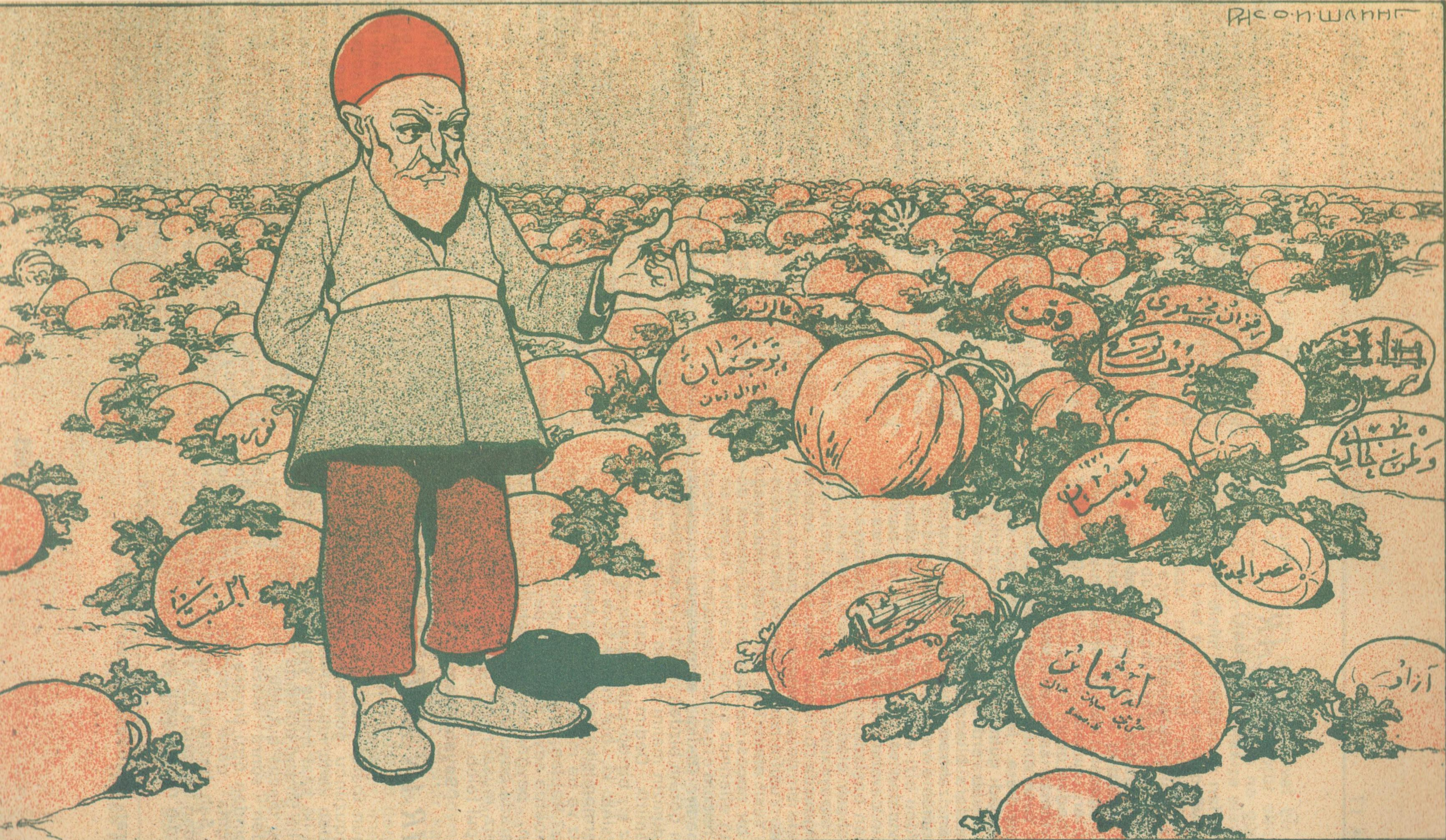
Dəxi bundan artıq hasil olmaz, allah bərəkət versin. Amma di gəl ki bu qədəri mən kimə satacağam?..