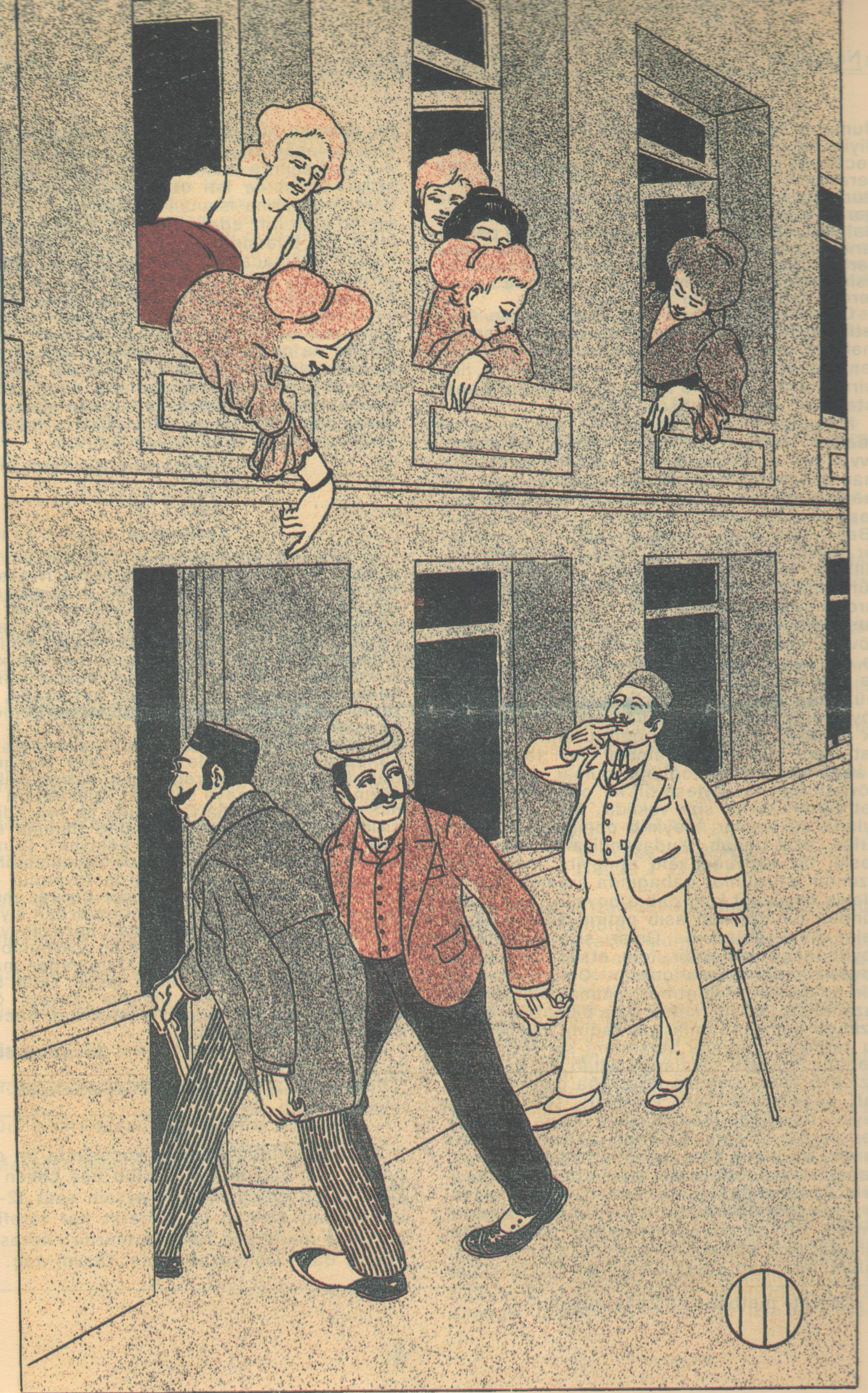
Tiflisdə "Sumbatov" küçəsi