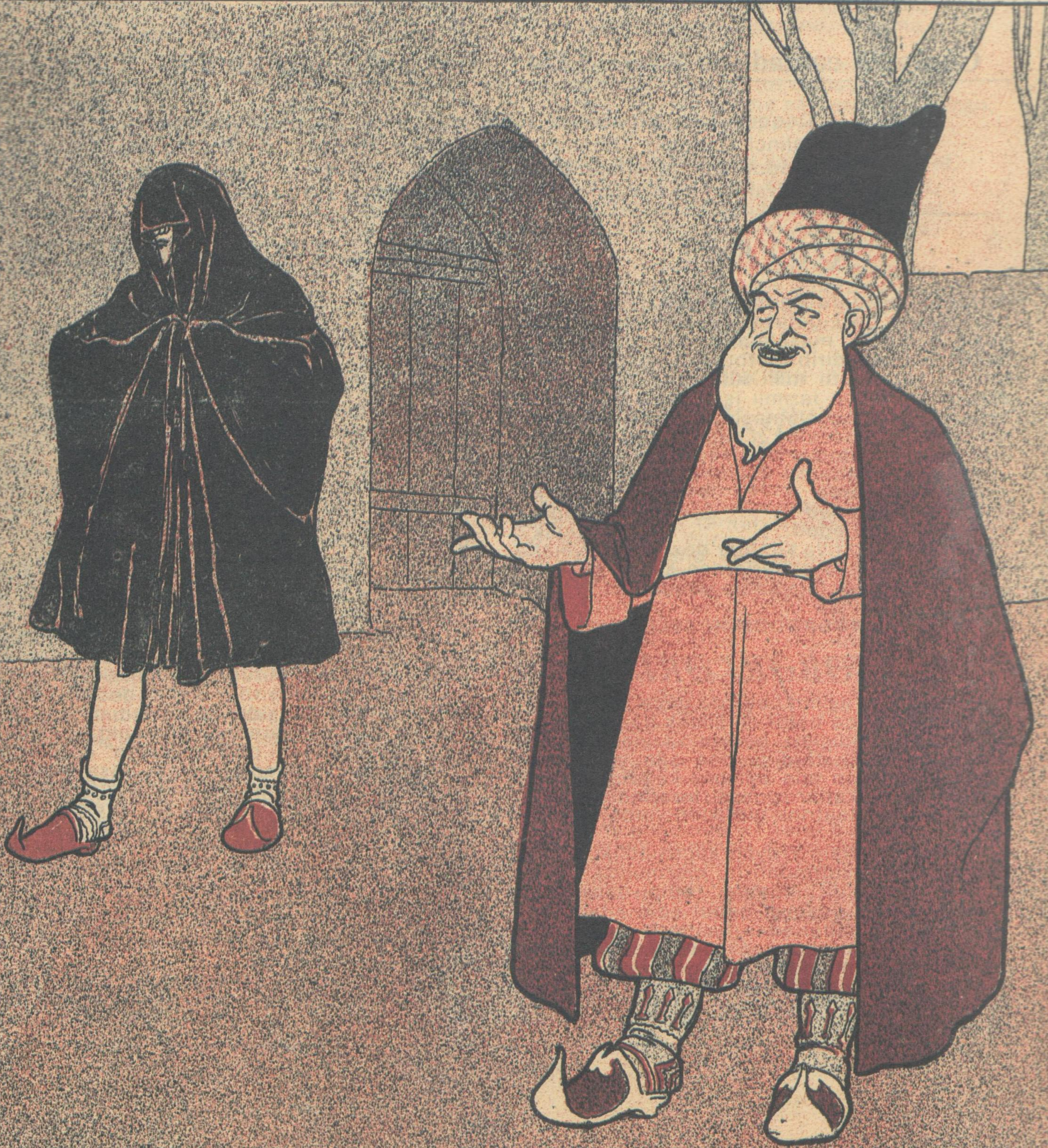
İrandan bizə çatan mətəin bir qismi