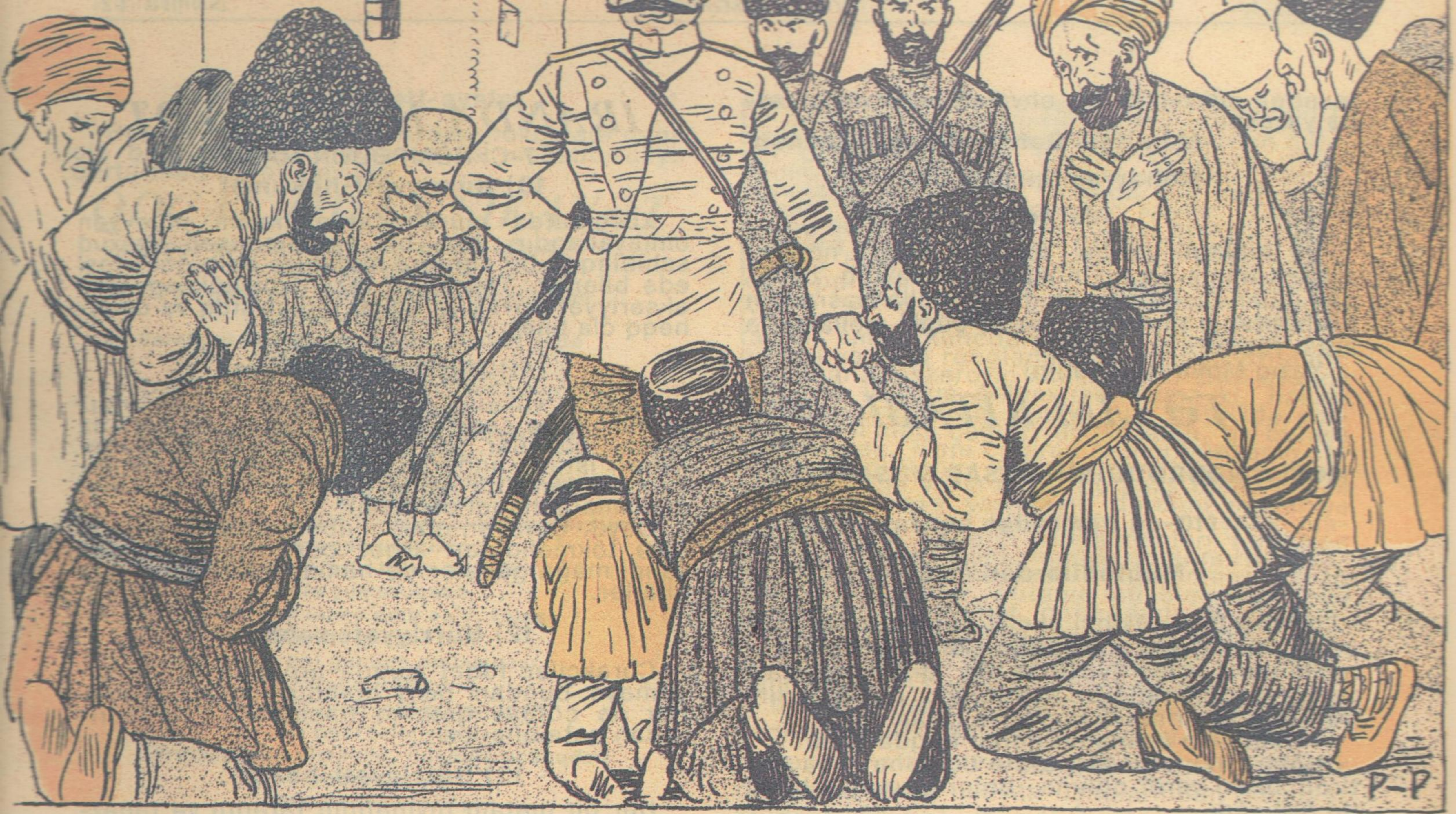
Hər nə salarsan aşına