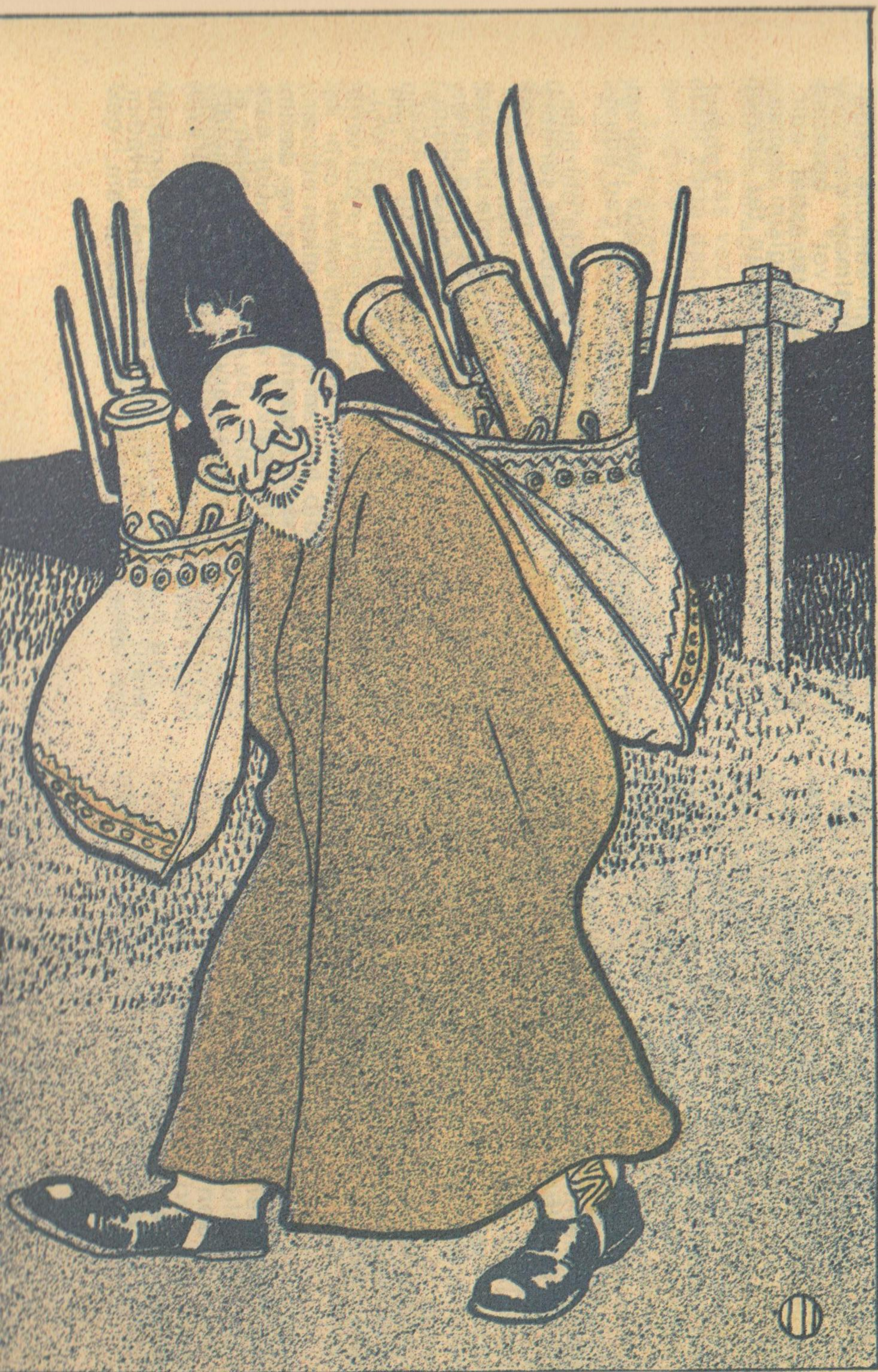
7. (Bax teleqramlara)