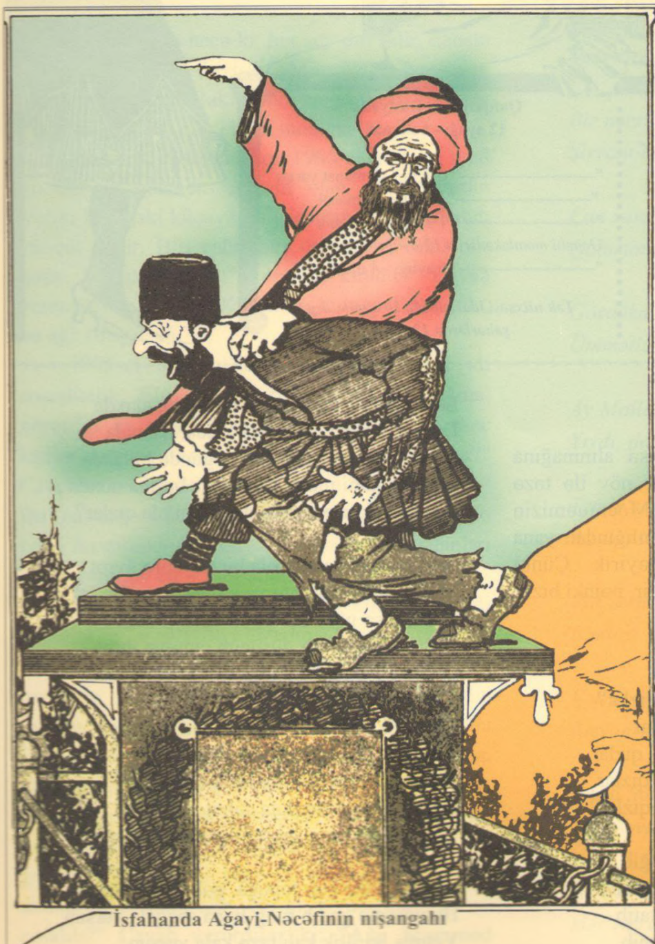
İsfahanda Ağayi-Nəcəfinin nişangahı