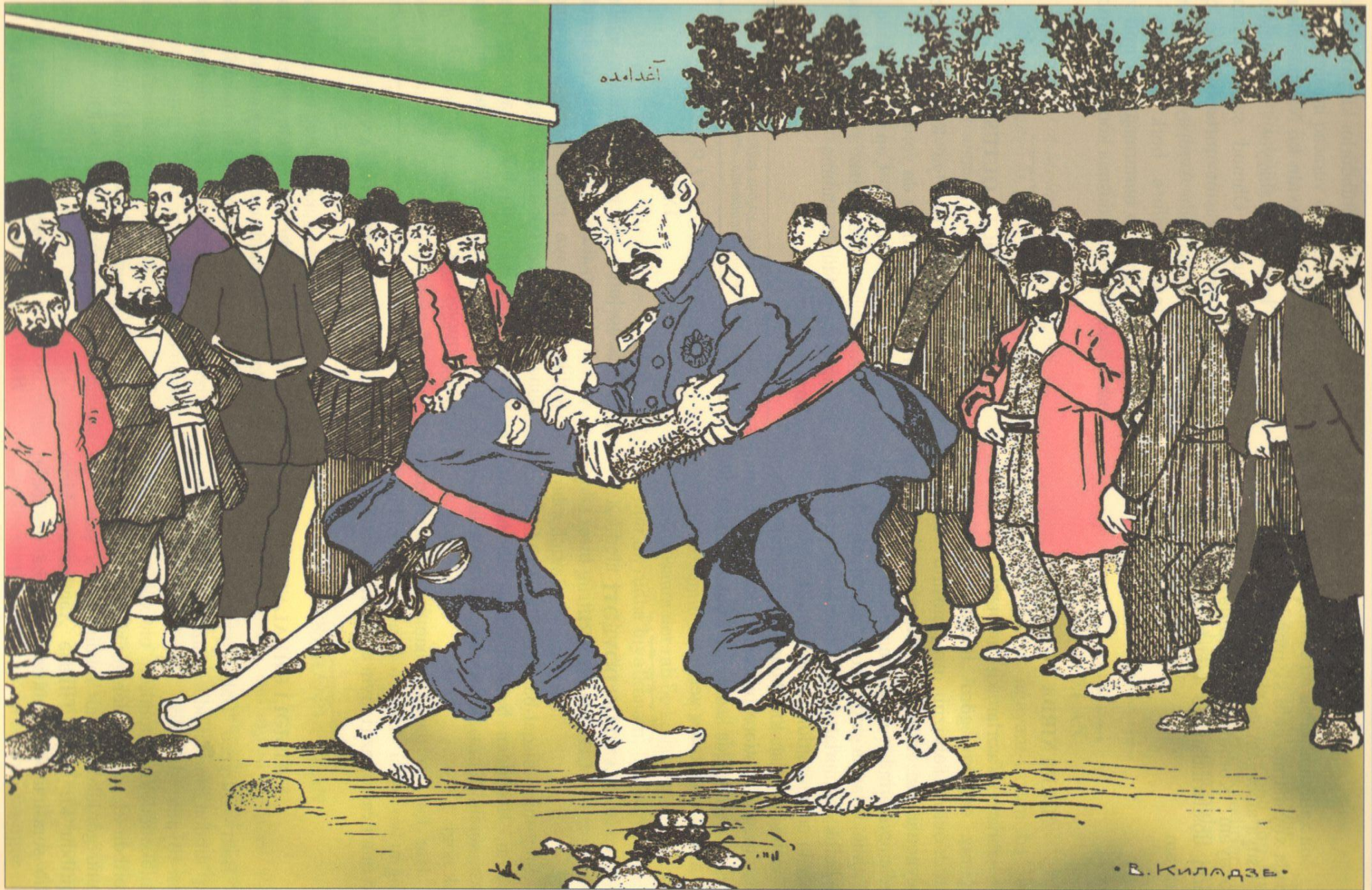
Görək hansı xan basacaqdr.