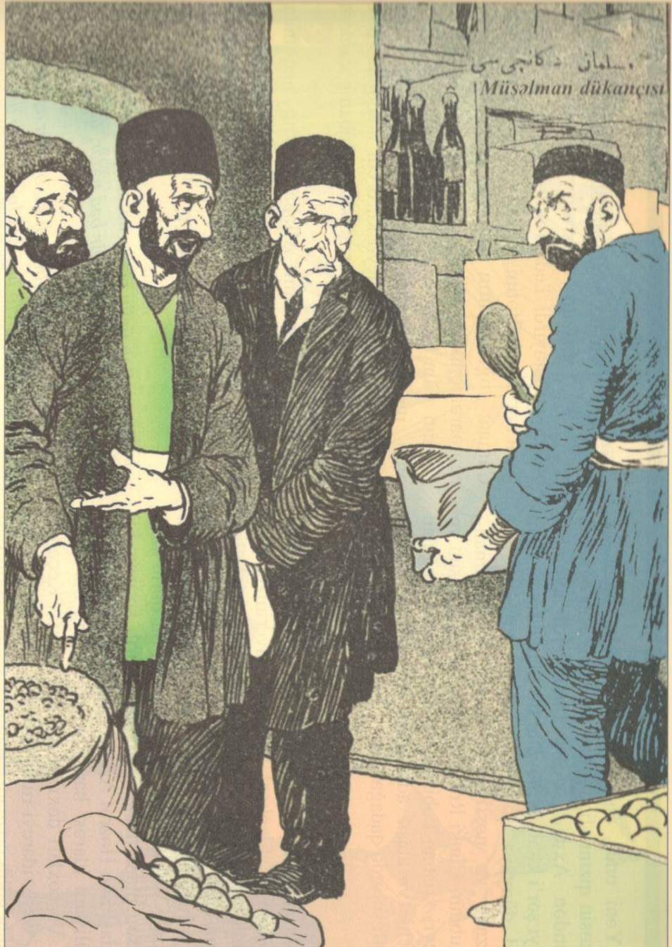
- Bar para müştərilər lap adamın zəhləsinə aparırlar: canım qiyməti odur, əskigə vermirəm də...