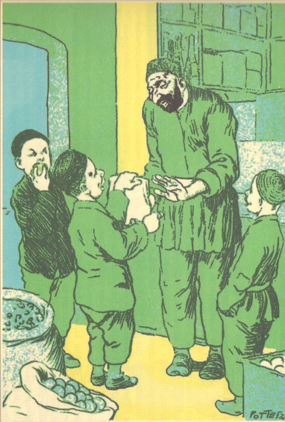
Pah nə demişəm, adamın müştərisi genə bu cür ürəkaçan ola, eyb eləməz.