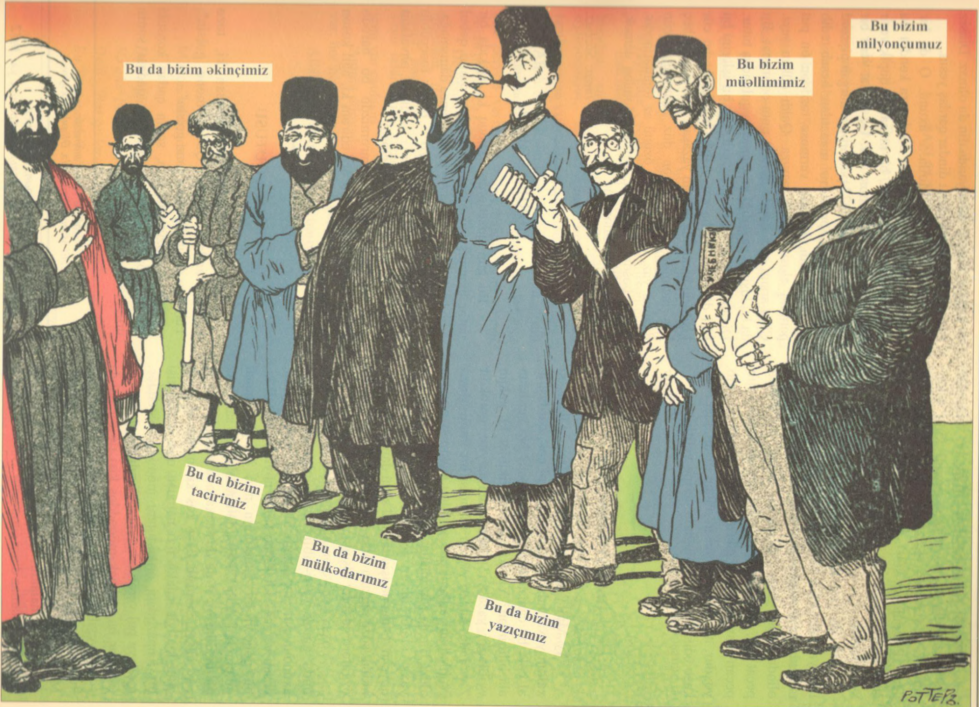
Bu da bizim äkinçimiz